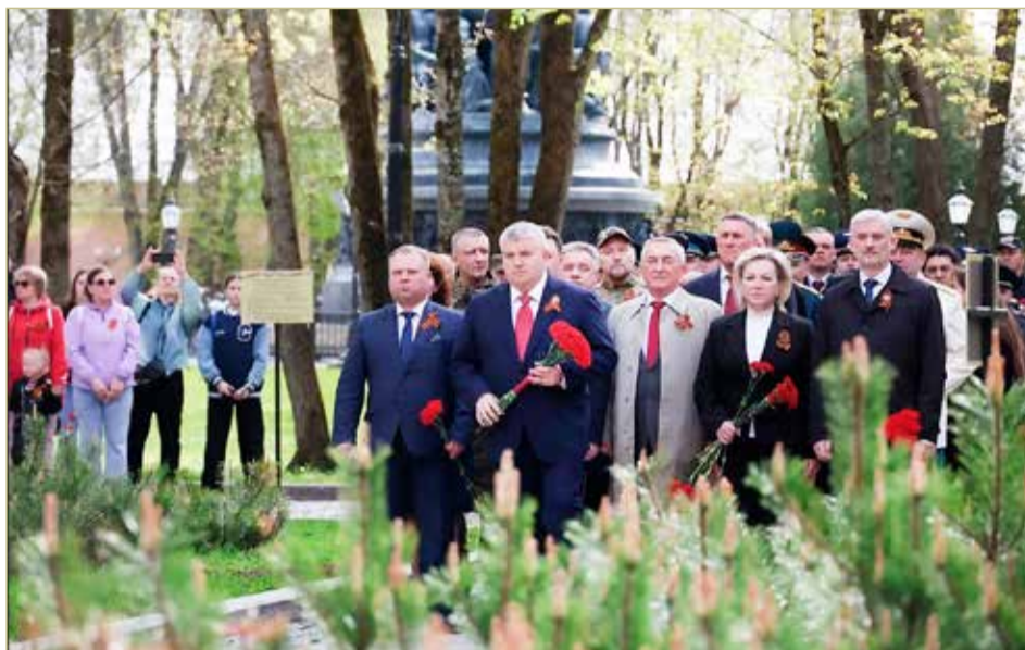
Красные гвоздики для ушедших героев — вечная примета мая.

— Памятник на трассе М11 стал собирательным образом этого солдата — защитника Отечества. Он вне времени, на века. Сегодня наши бойцы в зоне СВО продолжают дело дедов и прадедов, сокрушивших фашизм в 1945 году.