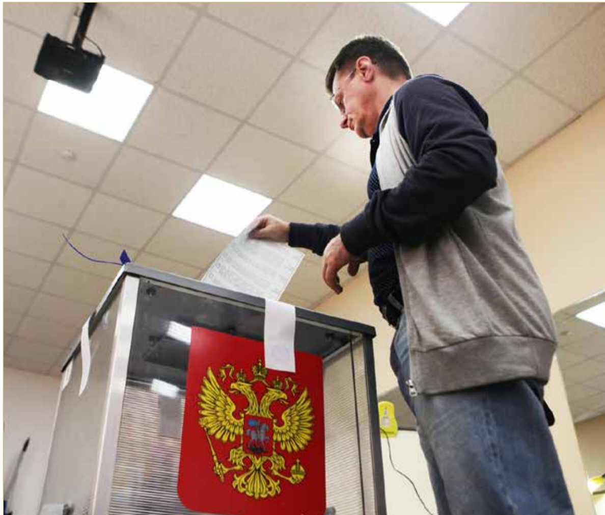
По мнению политологов, избиратель в Новгородской области весьма прагматичен.