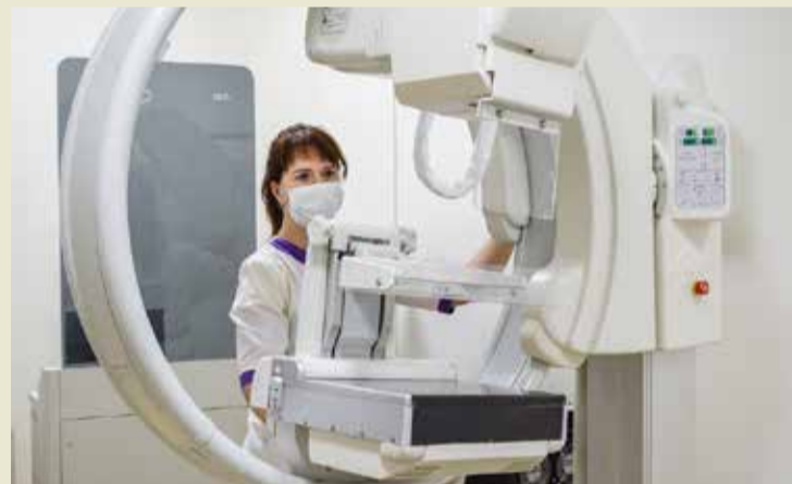
Приобретение современного оборудования в медучреждения — один из приоритетов Народной программы.

Как для председателя профильного комитета Новгородской областной Думы для меня особенно важно, что на форуме в Санкт-Петербурге с участием Дмитрия Медведева были представлены инициативы по развитию здравоохранения. Приоритетами Народной программы становятся развитие мобильной медицины, внедрение новых технологий в систему здравоохранения, приобретение для неё инновационного оборудования.