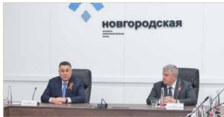
Полпред сообщил, что, несмотря на санкции, российские компании продолжают развивать технологический и промышленный суверенитет страны.

— В преддверии летних каникул очень важно уделять особое внимание трудовой практике молодёжи на промышленных предприятиях, — сказал полпред. — Вовлекать их в этот процесс для того, чтобы они учились работать в