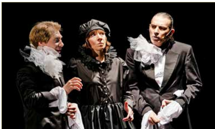
Не все осмелятся пройти через Зазеркалье. И для каждой Алисы это будет свой опыт.