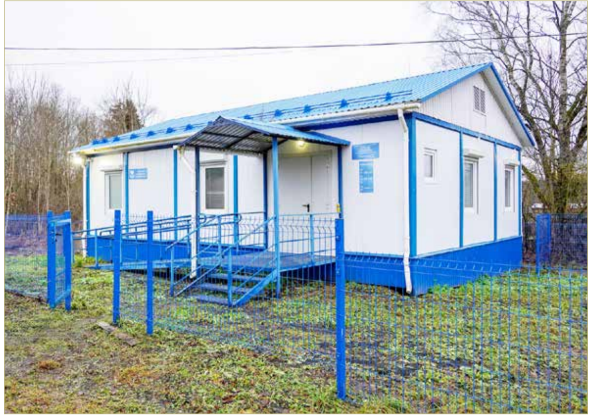
В этом году в регионе начнут работать ещё шесть ФАПов.