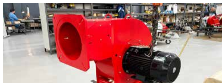
Важно развивать производства и создавать высокотехнологичные рабочие места в малых городах.

На примере нашего предприятия это хорошо видно. В 2023 году, когда «Старорусприбор» сменил собственника, перед нами встала задача возродить производство, вернуть