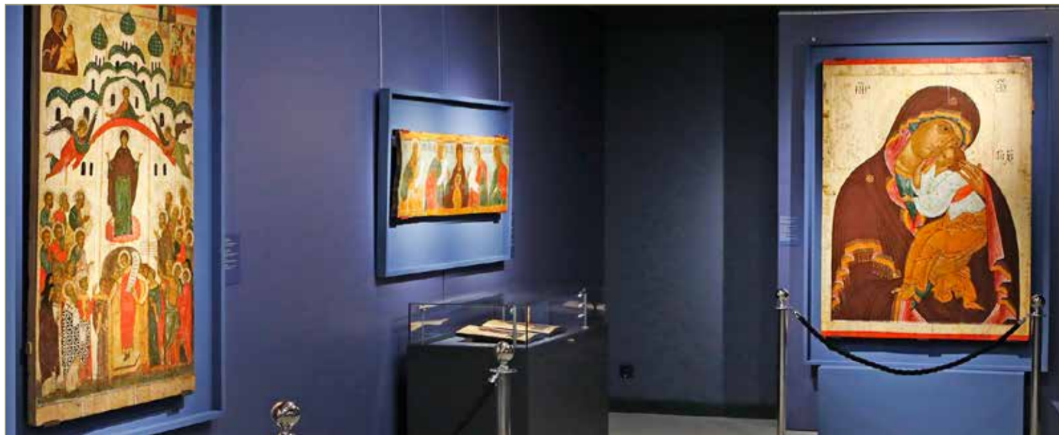
Особый интерес у посетителей выставки в Минске вызывает новгородская икона «Богоматерь Умиление» XV века.