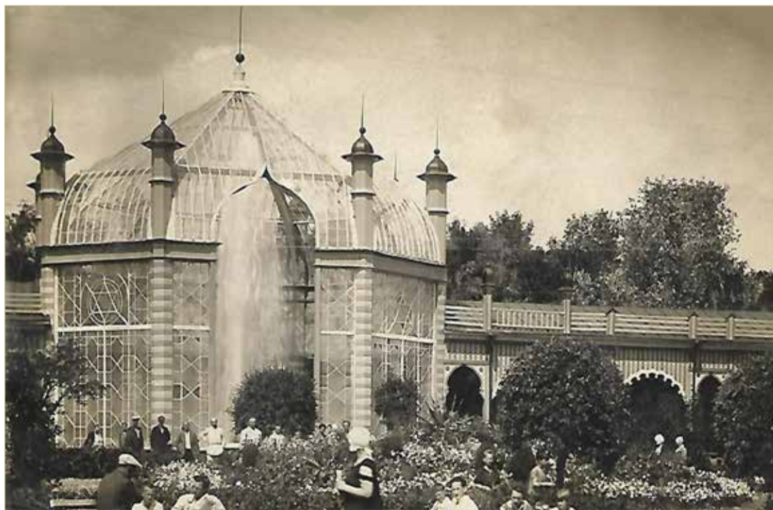
Стены шатра защищали фонтан от ветра, благодаря чему брызги не сносило далеко в сторону.

МУРАВЬЁВСКИЙ ФОНТАН ПОЛУЧИЛ СВОЁ НАЗВАНИЕ В ЧЕСТЬ СОВРЕМЕННОГО НИКОЛАЯ I И АЛЕКСАНДРА II — МИНИСТРА ГОСУДАРСТВЕННЫХ ИМУЩЕСТВ ГРАФА МИХАИЛА МУРАВЬЁВА, В ЧЬЁМ ВЕДЕНИИ НАХОДИЛСЯ СТАРОРУССКИЙ КУРОРТ.