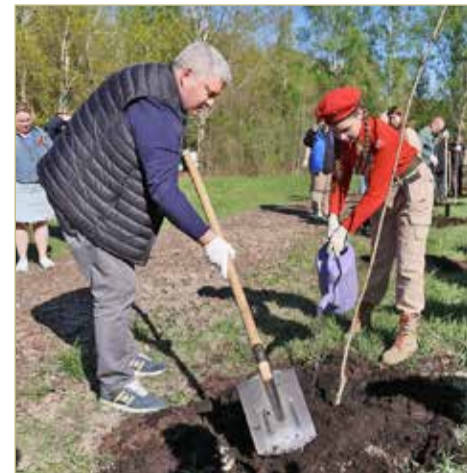
Кленовая аллея будет встречать следующие поколения новгородцев.

— Я рад, что мы продолжаем эту священную традицию — сажать деревья в знак благодарности героям Великой Отечественной войны. И что к акции присоединяется всё больше людей. Это значит, что жизнь продолжается. И защитники Новгорода, солдаты Великой Отечественной погибли не зря, — подчеркнул глава региона.