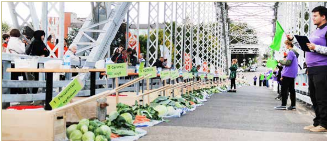
Главная заруба фестиваля проходит на мосту Белелюбского, где команды соревнуются в приготовлении крошева.